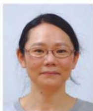
日本赤十字社 福井赤十字病院 外科 副部長