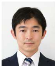
京都大学 白眉センター 特定准教授