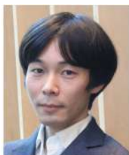
国立がん研究センター 研究所がん進展研究分野 分野長