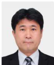
公益財団法人佐々木研究所 附属佐々木研究所 腫瘍ゲノム研究部 部長