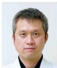
京都大学医学部附属病院 腫瘍内科 講師