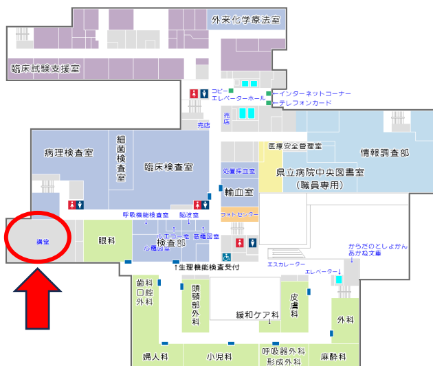
新潟がんセンター2階フロアマップ