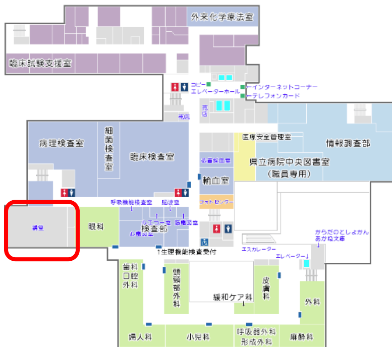
新潟県立がんセンター2階フロアマップ