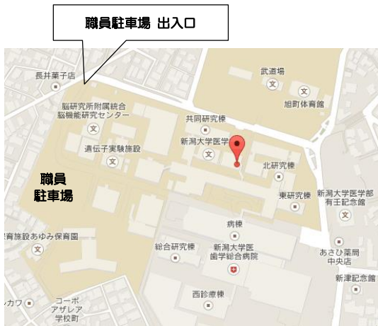
所在地：新潟県新潟市中央区旭町通一番町 757 番地 (新潟大学旭町キャンパス内)

新潟医療人育成センターの場所は、新潟大学医学部の赤門を入れて正面です。 お車で来られる方は、職員駐車場ゲートを無料開放しますのでご利用ください。