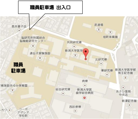
所在地：新潟県新潟市中央区旭町通一番町 757 番地 (新潟大学旭町キャンパス内)